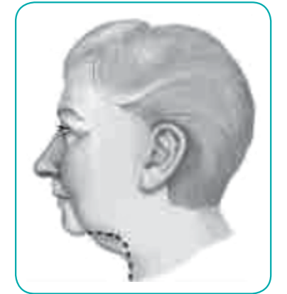
تتم خياطة عضلة المبطنّة الطبيعية (في الرقبة) ومرتكزها الليفي بإحكام أمام وخلف الأذن كوتر إضافي خلف الأذن