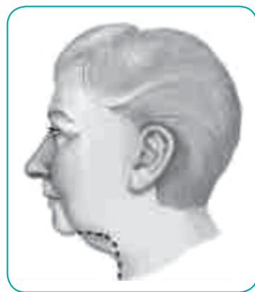
Platysma muscle and its fibrous attachment (SMAS) are sutured tightly in front and behind the ear as an extra string under the chin.