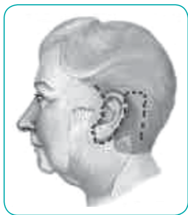
Incision lines follow the natural crease, of tagus, in front of the ear and extend into the hairline above and behind the ear.

The scars in the hair do not usually show except that the hair is cut shorter immediately around the wound. There may be some slight reduction in hair growth in the temples, but this is not usually a problem unless the hair is very thin and repeated facelifts are being carried out.